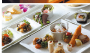
●JA全農なごみシート