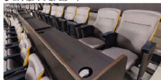
●ホークスラグジュアリーシート