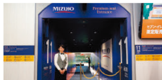
● くみずほ >プレミアムシート